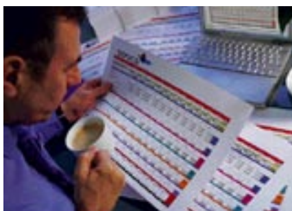
Fogli di calcolo in formato A3