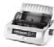
Stampanti ad aghi