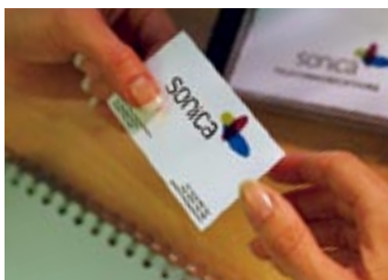
Biglietti da visita

E se avrete bisogno di più funzioni rispetto a quelle che la C9800 già offre - o se semplicemente vorrete razionalizzare lo spazio del vostro ufficio riservato alla tecnologia, potrete integrare la vostra C9800 con l'espansione MFP (C9800 MFP), in modo che possiate eseguire scansioni, copiare e inviare fax utilizzando un unico apparecchio di facile impiego.