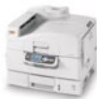
Stampanti a colori