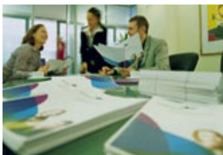
Documentazione per i clienti con pinzatura a sella