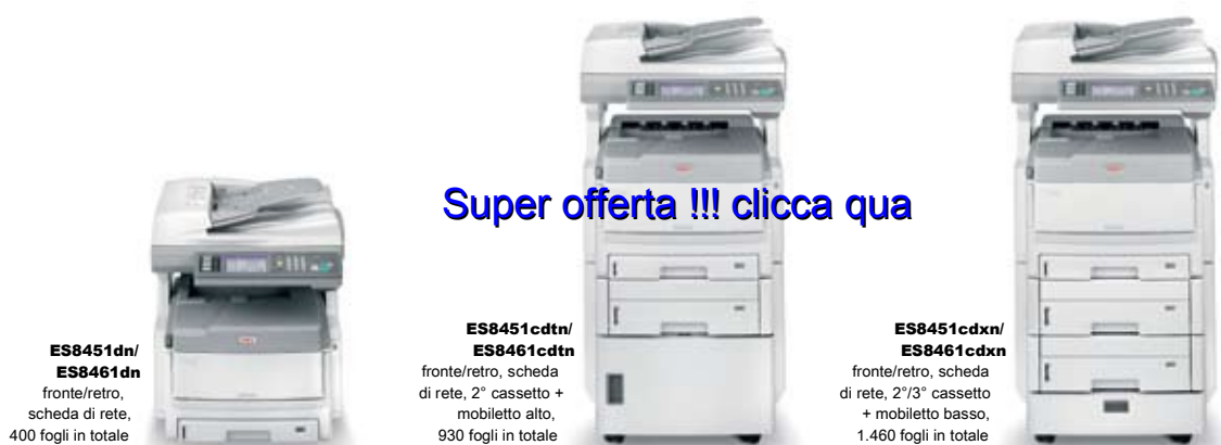
ES8451dn/ ES8461dn fronte/retro, scheda di rete, 400 fogli in totale